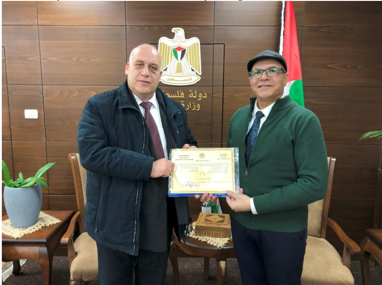
Figure 2. Getting approval of Accessibility Program from ministry of labor.