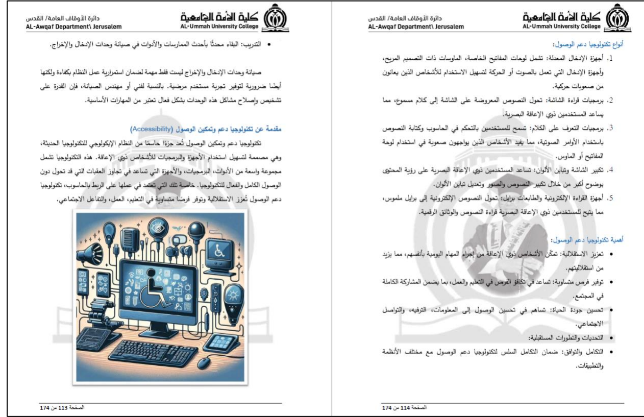
Figure 4. Part of training material used in Accessibility Courses